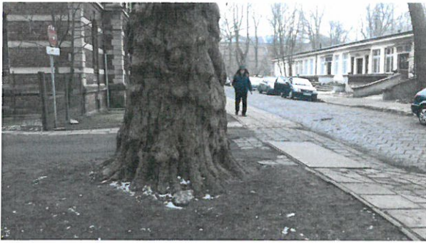
Dolna część pnia i chodnik w sąsiedztwie drzewa